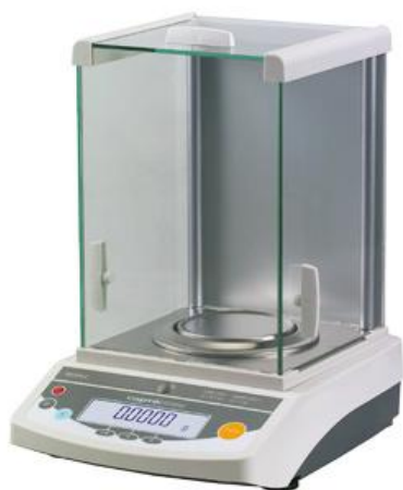
Рисунок 1 - Общий вид весов семейства I