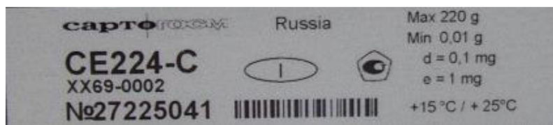
Рисунок 5 - Маркировка весов