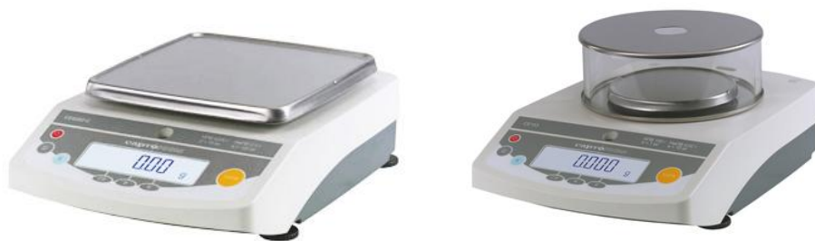
Рисунок 2 - Общий вид весов семейства II

Для защиты весов от несанкционированной настройки и вмешательства, которые могут привести к искажению результатов измерений, весы пломбируются гарантийной этикеткой изготовителя.