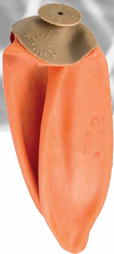
Камеры латексные для спортивных мячей